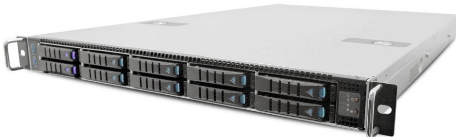
Рисунок 1. Вычислительный сервер «ИРИДИУМ ИР-110Х»

Внешний вид вычислительного сервера «ИРИДИУМ ИР-110Х» представлен на рисунках 1, 2, 3 и 4.